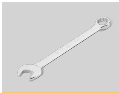
两用扳手 镜面抛光处理,硬度高扭矩大,不易生锈