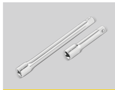
延长杆 狭小空间,给力拧卸