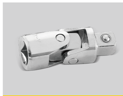
万向头 万向使用 灵活作业